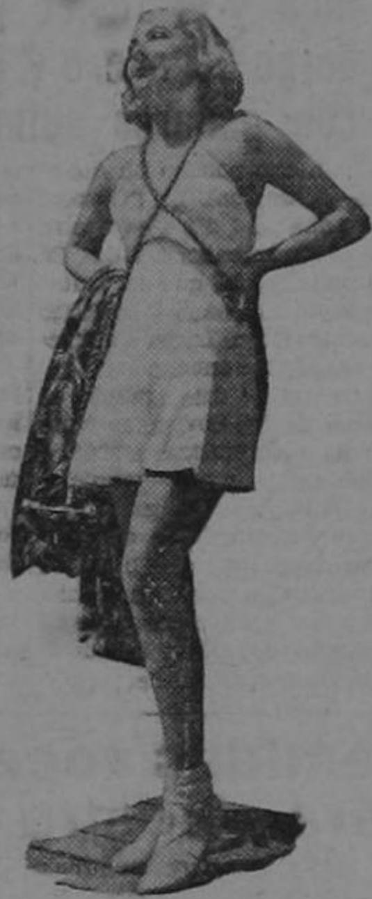
Pronto hubieron pasado las primeras semanas de mi contrato, y como me asignaron un sueldo muy... (PASA a la PAGINA 12)

Como al día siguiente tenía que comenzar a actuar en la película "Las Masas Rügen", llegué vestido de blanco... Inmediatamente todo el mundo se fijó en eso, y como pasaban los días y yo cambiaba de trajes y todos eran blancos, en breve se asoció mi nombre a ese hábito de vestir de blanco, y ahora con entera franqueza digo que lo que empecé por necesidad ahora me encanta.